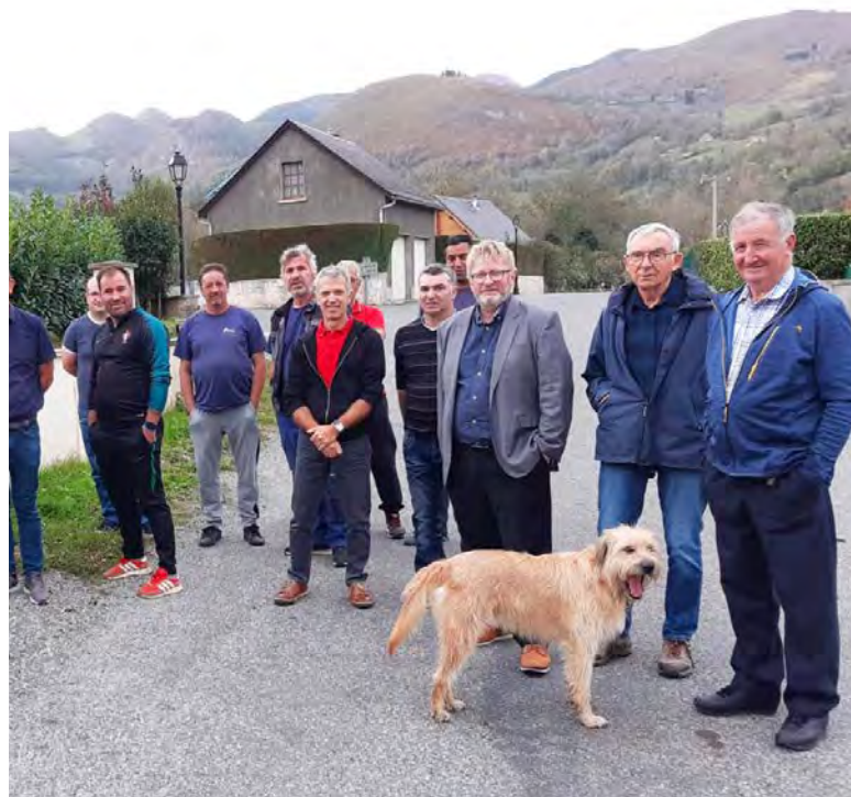
Les travaux, lancés en novembre 2021, ont enfin pris fin, et le résultat fait l'unanimité.

réseaux d'éclairage public et de télécommunication), et de rendre au paysage toute sa beauté. En rénovant l'éclairage public, l'opération permet de faire des économies d'énergie, de requalifier le paysage nocturne et de lutter contre la pollution lumineuse. La technologie Led est en ce sens très adaptée : elle permet une optimisation des couleurs (ici jaune ambré), un éclairage plus localisé sans émission vers le ciel ou vers des espaces perdus, une diminution de l'éclairage en 2ème partie de nuit. Cet éclairage est ainsi conforme à la Réserve Internationale de Ciel étoilé (RICE) du Pic du Midi. Cette opération permet aussi d'améliorer l'alimentation en rénovant des réseaux vieillissants et en augmentant leur capacité dans un contexte de besoins en énergie en augmentation, ce qui justifiait le renouvellement des postes de transformation électrique. En associant les rôles et compétences du SDE65 et d'Enedis, l'opération a permis une réalisation complète de l'enfouissement de l'entrée du bourg et de l'amélioration de tous les réseaux, en optimisant les moyens consacrés par les uns et les autres.