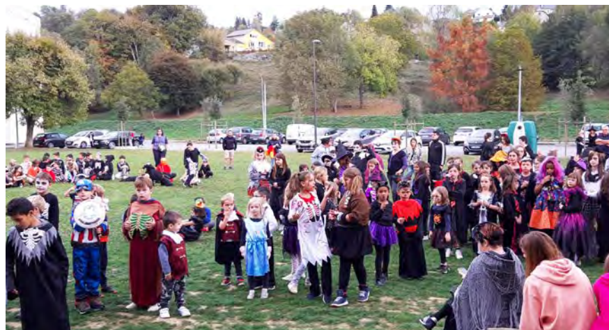
Les enfants sont venus en nombre, en famille ou du centre de loisirs.

L'animation a été assurée par Aria Animation qui a proposé de nombreux jeux musicaux. La chasse aux bonbons et le goûter offert par le Comité des Fêtes a ont eu un vif succès, toutes les personnes présentes ont apprécié l'initiative du comité qui a su mettre à profit la nouvelle maison de quartier de Clair Vallon, gracieusement mise à disposition par la ville de Bagnères. Le comité des fêtes de Bagnères-de-Bigorre a également tenu à remercier le magasin Aldi pour son soutien dans l'organisation de cette manifestation.