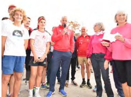
4 DON. La Ligue contre le cancer du sein s'est vu remettre trois chèques par les associations sportives de la ville.