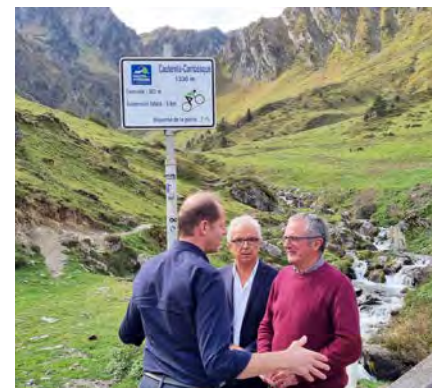
L'arrivée se fera au terme d'une ascension finale de 15km à 5% de moyenne.

Quant à la fameuse première victoire de Miguel Indurain en 1989, Christian Prudhomme, plus que jamais une encyclopédie du Tour de France, se