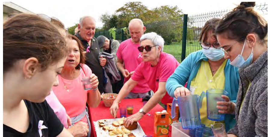
2 RAVITAILLEMENT. Le point ravitaillement était organisé par le personnel de l'Ehpad de Maubourguet.