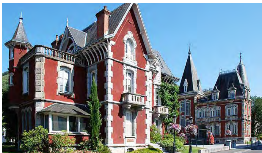
L'accueil a été déplacé en face de l'hôtel de ville.