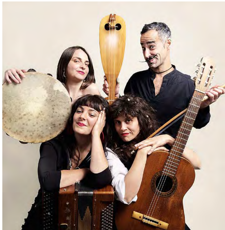
Après l'initiation à la tarentelle de 14h, le groupe Alberi Sonori donnera son concert à 17h.