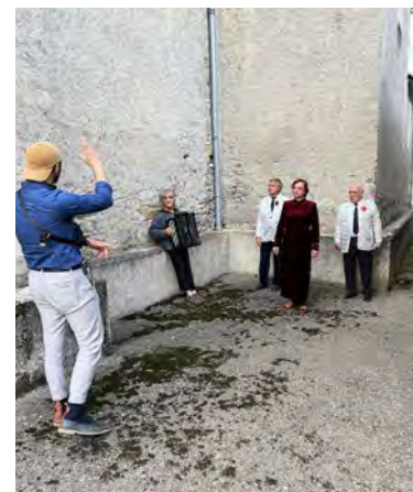
Dans les rues de Gazave, les trois acteurs faisaient ressortir une émotion bien particulière

l'interprète du personnage, est d'ailleurs l'ancienne professeure de théâtre de l'équipe : « Nous travaillons de manière épurée sur un sujet qui porte, ce problème est multigénérationnel. » Pour une partie de la petite troupe, ayant grandi aux pieds des Pyrénées, l'ambition est donc toute trouvée : il s'agit de valoriser les paysages ainsi que les valeurs qui leur ont été inculquées. « On ne sera jamais autre chose que