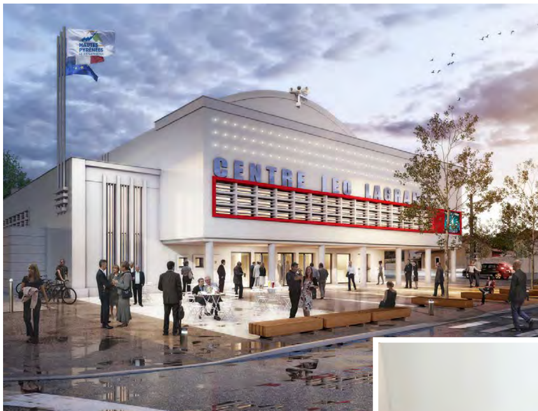
Voici à quoi doit ressembler la façade du centre culturel Léo Lagrange dans deux ans.

« On a souhaité connaître les impressions des Séméacais car il s'agit d'un projet très important pour la vie de la commune, poursuit le maire. Il y avait donc un cahier en mairie, dans lequel les habitants ont pu donner leur avis et faire des remarques. » Plébis-