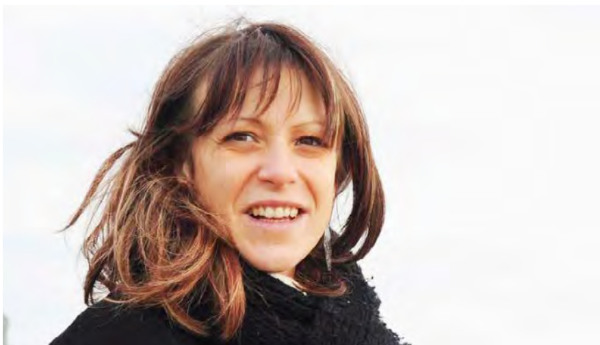
La femme, âgée de 41 ans, a disparu sur le secteur de Lourdes.

Le procureur de la République de Tarbes a déclaré en début d'après-midi, peu avant l'interpellation du suspect à nos confrères de Sud-Ouest . « Ce 26 octobre en fin de soirée à Maubourguet, un individu s'est présenté devant un appartement et a frappé à la porte de l'appartement. Il aurait tiré avec une arme à feu au niveau de la tête de l'occupant de cet appartement. Il semblerait que ces deux personnes auraient un contentieux sur fond de jalousie par rapport à la compagne de la victime. L'auteur aurait tiré plusieurs fois en l'air en quittant les lieux. Une enquête de flagrance du chef d'assassinat a été ouverte. Il ressortirait des premiers éléments que l'auteur des faits aurait agi de manière imprévisible, sans avoir laissé paraître aucun signe avant-coureur. Les forces de l'ordre sont allées vérifier ses différents points de chute. Il a été interpellé sans incident hier en fin de journée par les forces de l'ordre. »