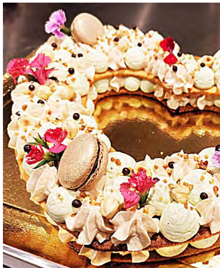
Lola réalise également des gâteaux créatifs.

Téléphone : 06.37.83.63.14 Page Facebook : Lola Campagne Chef à Domicile Site internet : www.lolacampagne.fr