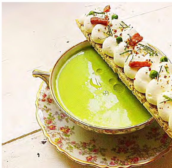
L'une des créations salées de Lola.

Pour les menus composés, il y a différentes possibilités : le menu classique à partir de 35€ (entrée de saison, plat mijoté et dessert de saison), le menu plaisir à partir de 45€ (mise en bouche, entrée de saison, plat de viande ou poisson, dessert de saison) et le menu prestige, à partir de 60€ (mise en bouche, entrée de saison, cassolette de poisson, plat de viande, plateau de fromages et dessert de saison). Lola Campagne tend également vers l'épicerie fine. Depuis juin, elle crée ses propres produits, et a actuellement trois points de vente dans le secteur : "La Cave de l'Arsenal", à Tarbes, l'épicerie "Retour aux sources" à Aureilhan, et "La Ferme du Padouen" à Mun. Pour l'automne, la jeune femme a d'ailleurs sorti deux nouveautés : du granola et du fromage à tartiner,