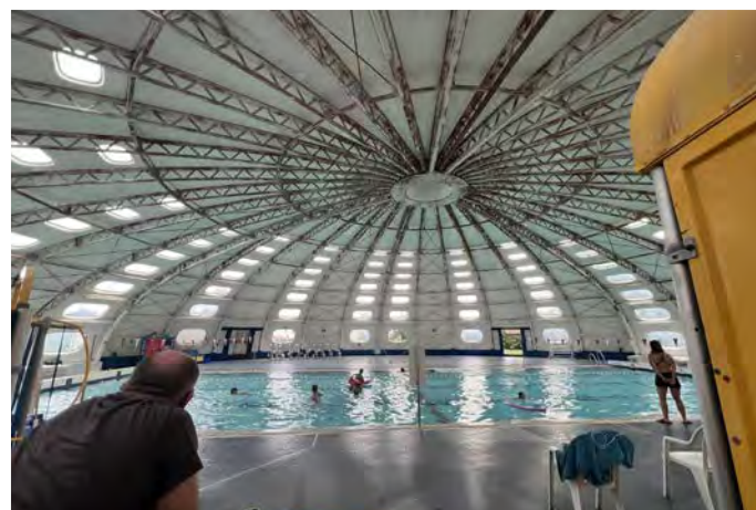
La Piscine Tournesol de Lannemezan

Prolongé jusqu'en décembre 2022 pour le gaz, et jusqu'au 1er février pour l'électricité, le bouclier tarifaire sera reconduit jusqu'en 2023. L'objectif est de pallier la forte hausse attendue sur les prix de l'énergie auprès des ménages et des petites entreprises. La hausse des tarifs de gaz et d'électricité sera ainsi limitée à 15%. L'augmentation moyenne des factures sera donc de l'ordre de 25€ pour les ménages chauffés au gaz et 20€ pour ceux en électricité, et aurait été de 180€ à 200€ sans cette mesure de bouclier tarifaire. Les coll. locales ne sont pas concernées.