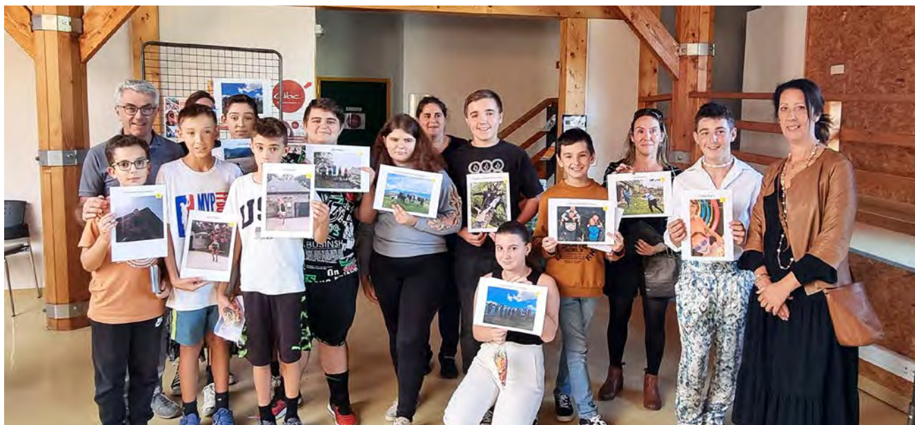
Les jeunes participants ont reçu leur récompense dans les locaux de la maison France Services.

Parce que c'était une première édition, mais aussi parce qu'il fallait remercier tous les participants pour leur investissement, chaque concurrent a reçu sa petite enveloppe en récupérant sa photo, avant de pouvoir profiter du goûter mis en place. Mais comme tout concours, il fallait bien un vainqueur, et un classement a été établi, avec 4