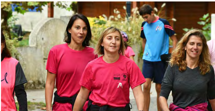
1 PARTICIPANTS. 257 personnes ont pris le départ, samedi 29 octobre, de la marche caritative de 6 km dans Maubourguet.

MAUBOURGUET. La première marche organisée dans le cadre d'Octobre rose, en faveur de la Ligue contre le cancer du sein, a été une réussite : 257 marcheurs se sont mobilisés.