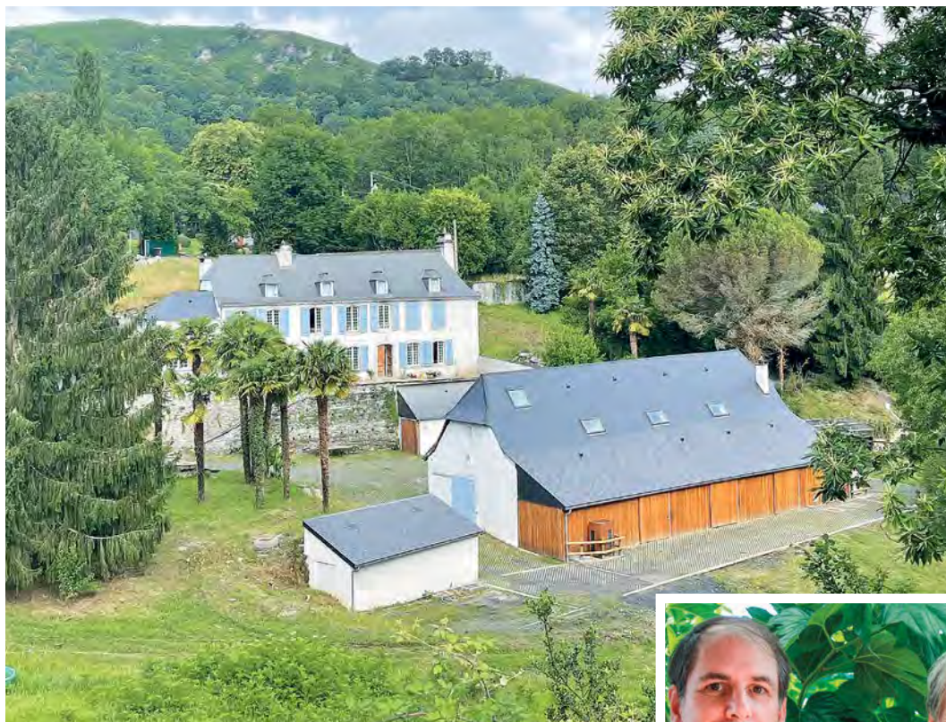
Le site où toutes les crèmes sont confectionnées se situe à Lourdes, sur le terrain d'où est puisée l'eau de source.