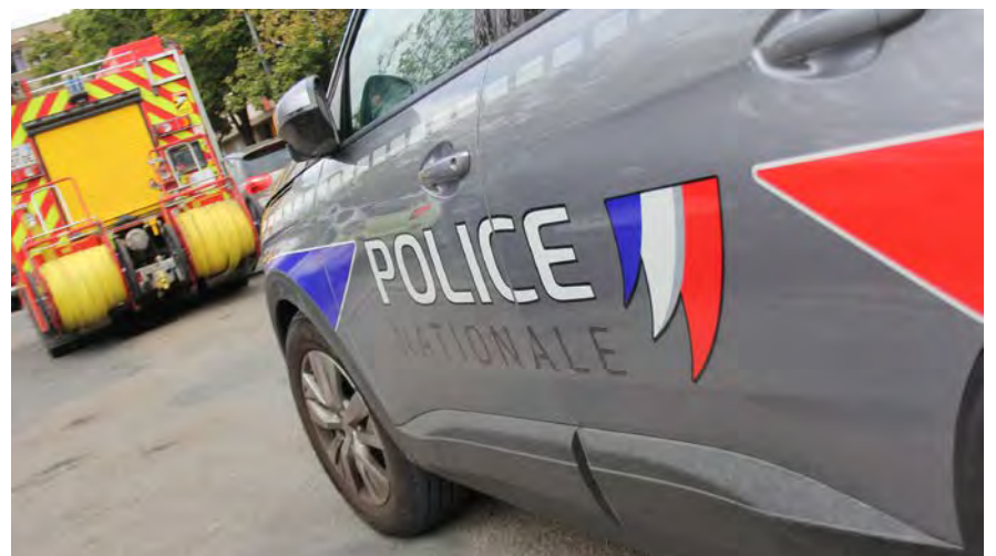
Le drame avait eu lieu le 1er avril 2020, en plein confinement.