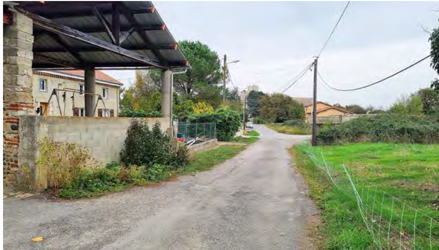
Le meurtre a eu lieu dans une maison de ce quartier isolé de Maubourguet, habituellement d'un calme absolu.

Selon les informations glanées par nos confrères de La Dépêche du Midi , un homme se serait rendu au domicile de la victime, qui vivait avec son ex-compagne dans un appartement sur Maubourguet, rue du Bourg Vieux. L'homme aurait alors sonné à la porte, et abattu la victime à l'aide d'une arme à feu avant de prendre la fuite en direction de son domicile situé dans les Pyrénées-Atlantiques, sur la commune de Bassillon-Vauzé, à quelques kilomètres de Maubourguet. Retraîné chez lui, l'individu armé a fini par se rendre en fin d'après-midi, a annoncé la préfecture des Pyrénées-Atlantiques, qui avait auparavant prévenu qu'une opération était en cours sur la commune et que le secteur était à éviter.