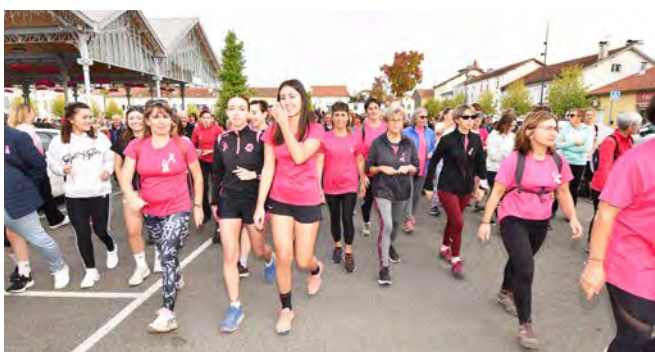
3 SOLIDARITÉ. Jeunes et moins jeunes étaient réunis pour la bonne cause.