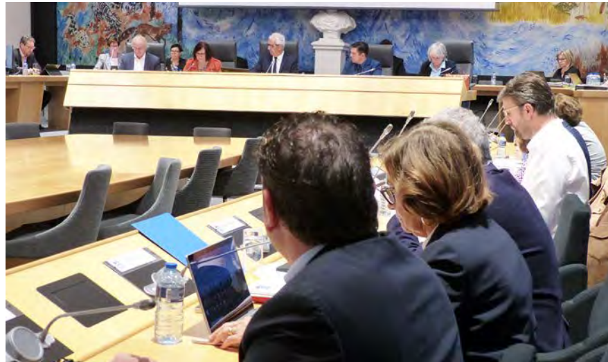
La création de nouvelles retenues d'eau a fait quelques vagues lors de la dernière séance de conseil départemental.