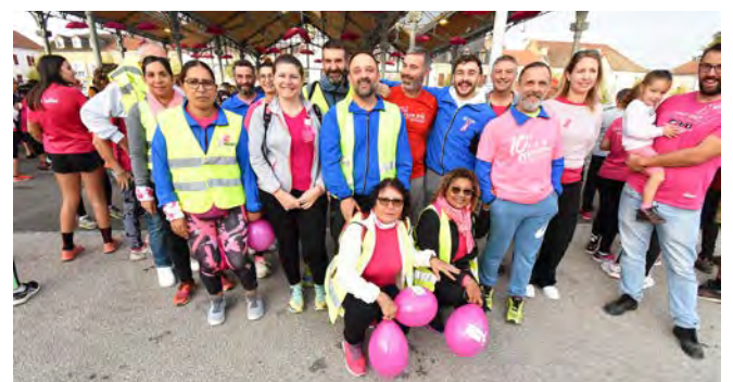
5 RENDEZ-VOUS EN 2023. Après cette réussite, une nouvelle marche est prévue pour octobre 2023.