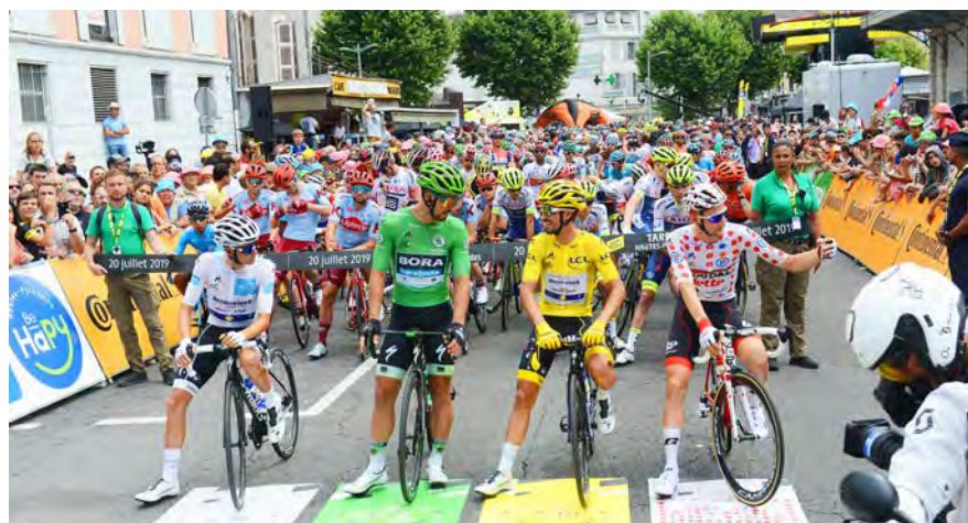
Le dernier départ de Tarbes pour une étape du Tour de France a eu lieu en 2019.